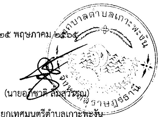
นายกเทศมนตรีตำบลเกาะพะงัน

หมายเหตุ ผู้ประกอบการสามารถจัดเตรียมเอกสารประกอบการเสนอราคา (เอกสารส่วนที่ ๑ และเอกสารส่วนที่ ๒) ในระบบ e-GP ได้ตั้งแต่วันที่ซื้อเอกสารจนถึงวันเสนอราคา